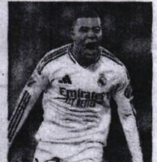
A LA ORDEN. "Kiki" superó un esguince en la rodilla izquierda.

"Mbappé está al 100%. Máxima ilusión en tener de vuelta